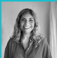
Esc. Rosana García Paz